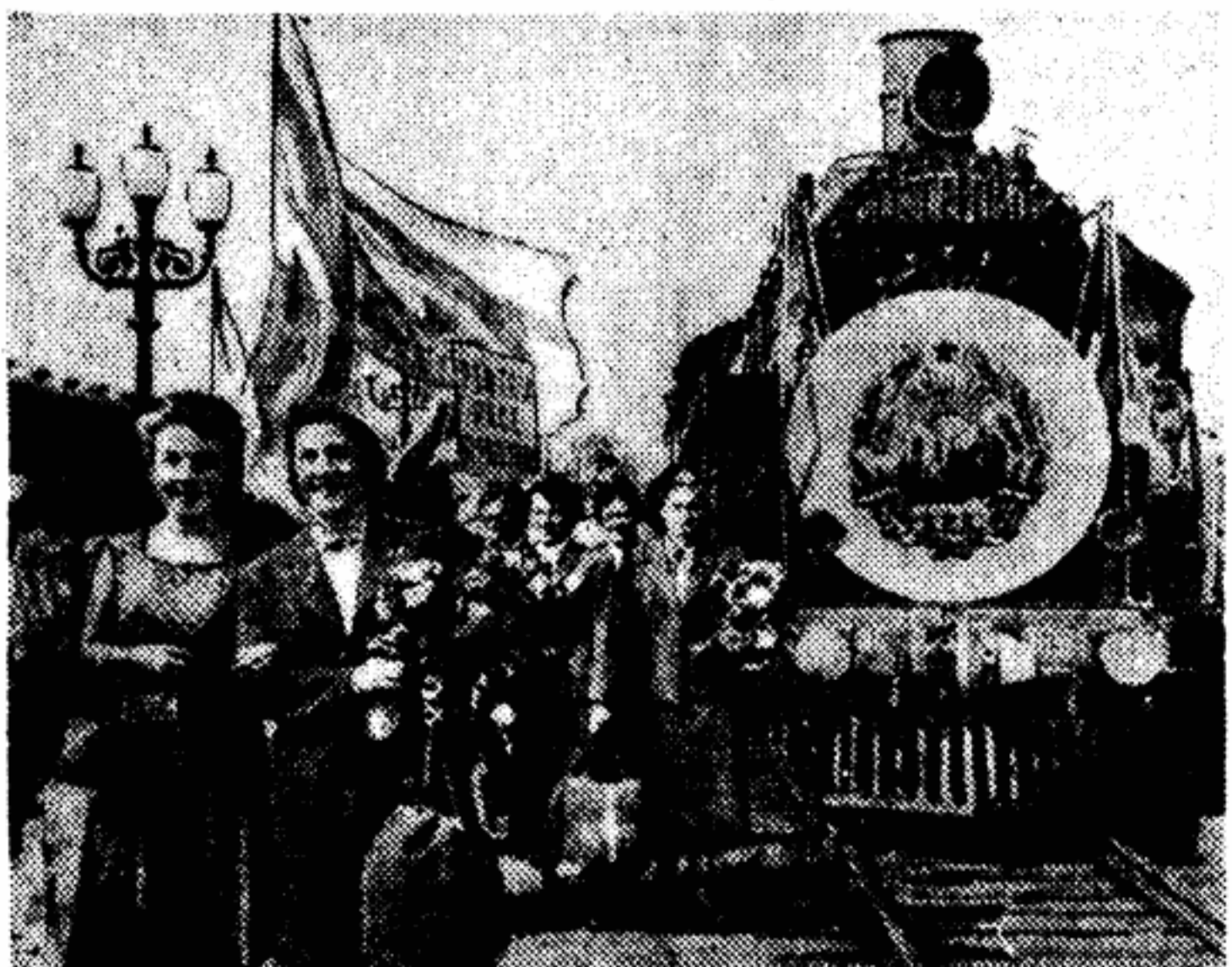
Солнечным днем минувшего воскресенья выезда и аэропорт Фелицы продолжили принимать гостей из Львова. Рано утром и перерыву Киевского вокзала подвезли поезд украинского герба и флаги Румынской Народной Республики. Он привез триста румынских спортсменов на III Международные дружеские спортивные игры. А несколько позже молодежь Москвы радостно встретила посланцев Юности и мира международной группы из Индии.