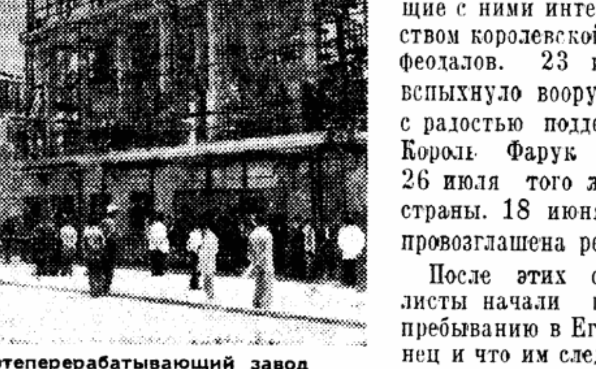
Новый нефтеперерабатывающий завод в Александрии.