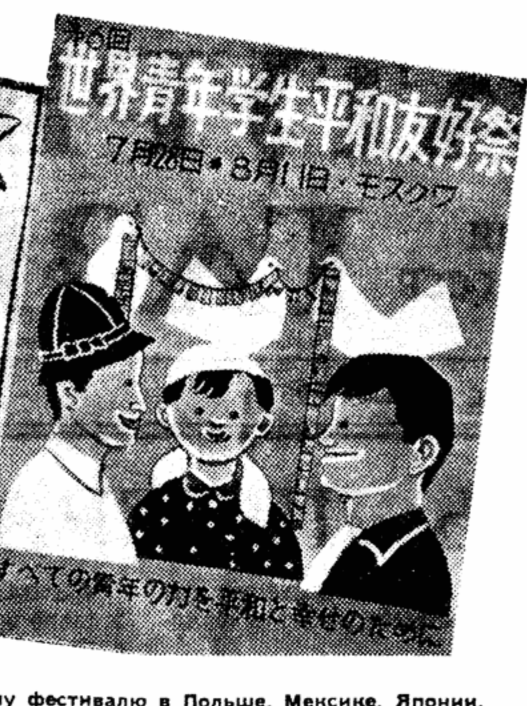
Плакаты, выпущенные к VI Всемирному фестивалю в Польше, Мексике, Японии.